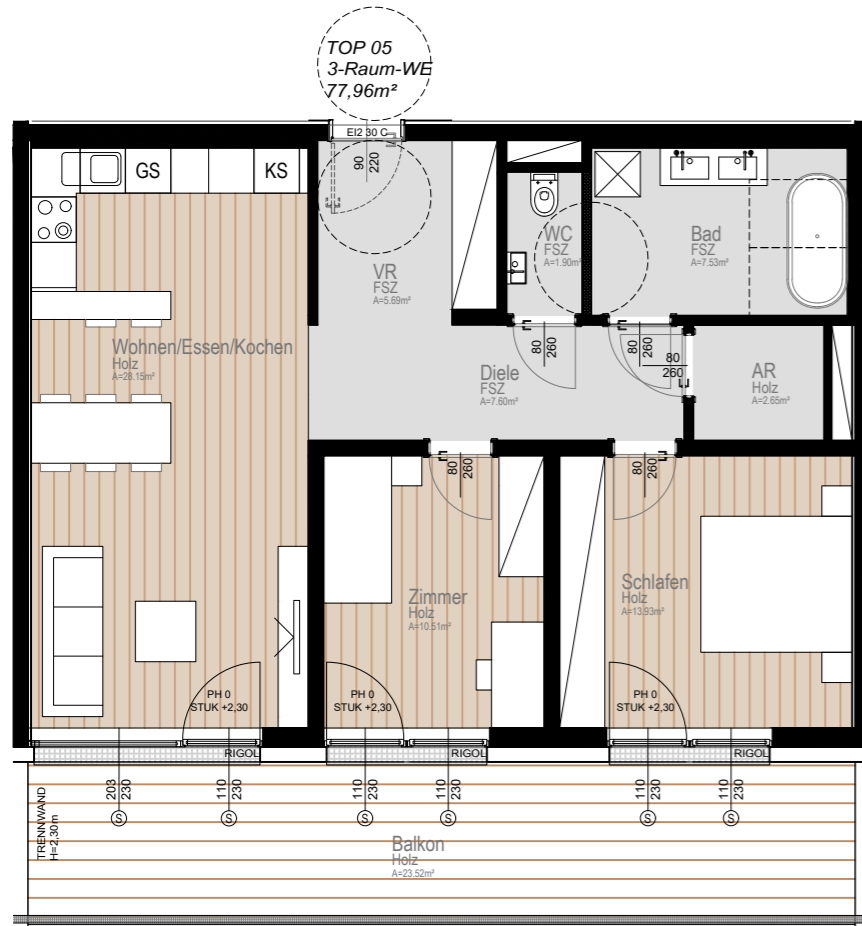
ERDGESCHOSS I TOP 05 M 1:100